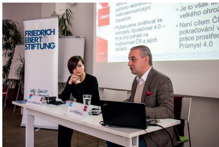
Odborová akademie 2016 | Foto: archiv