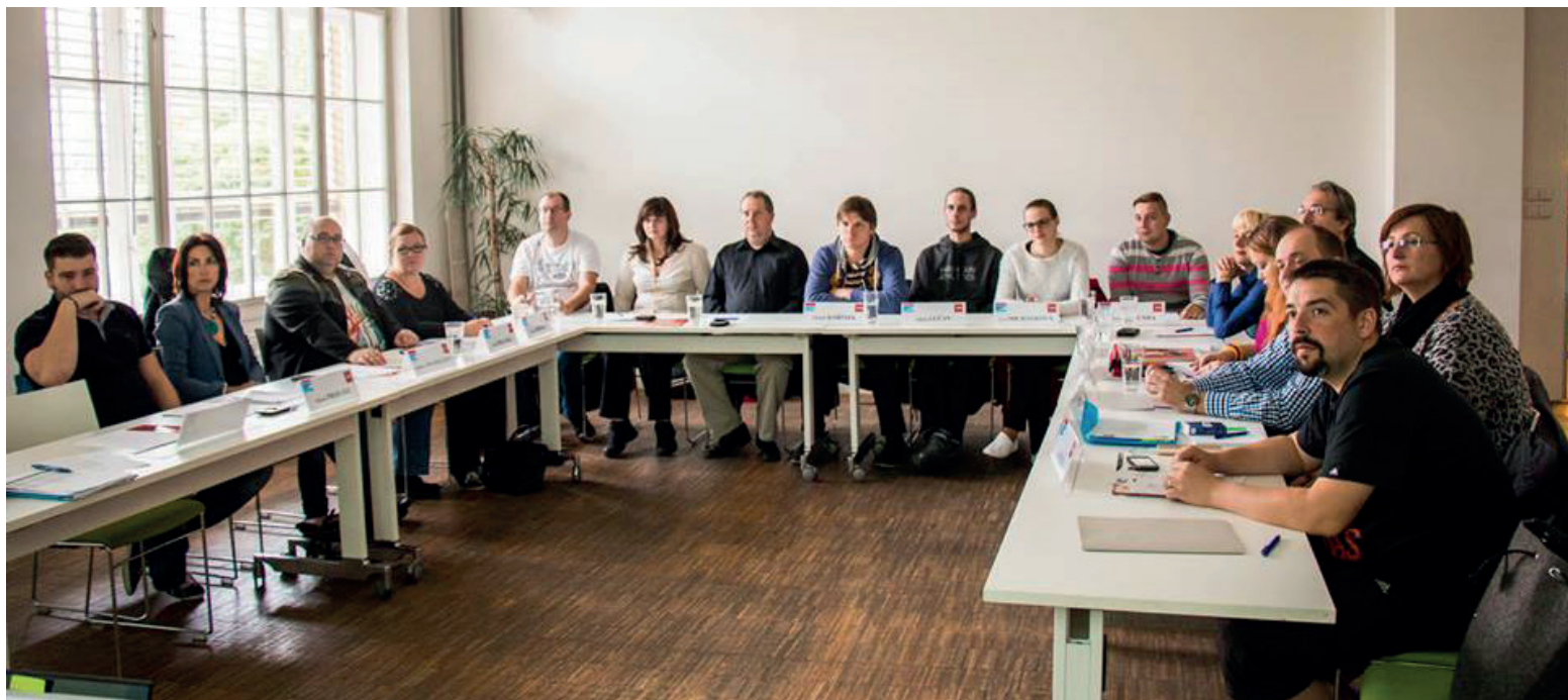
Odborová akademie 2016 | Foto: archiv