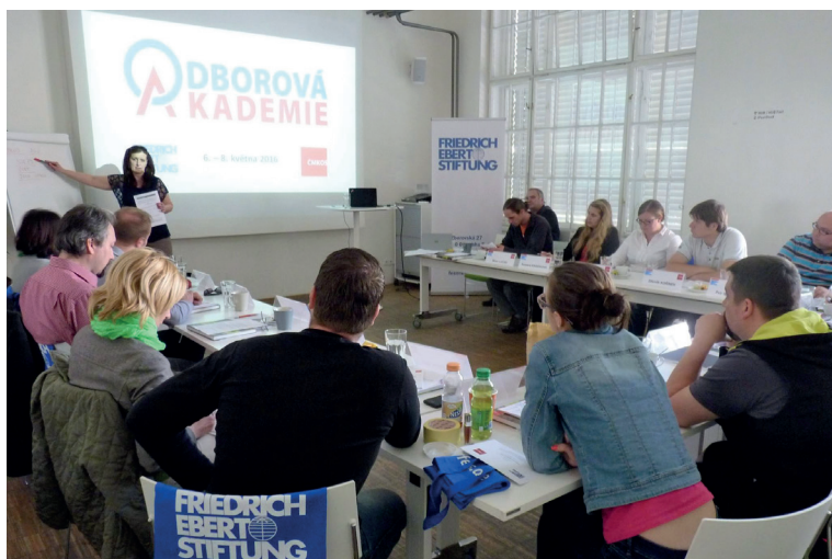
Odborová akademie 2016