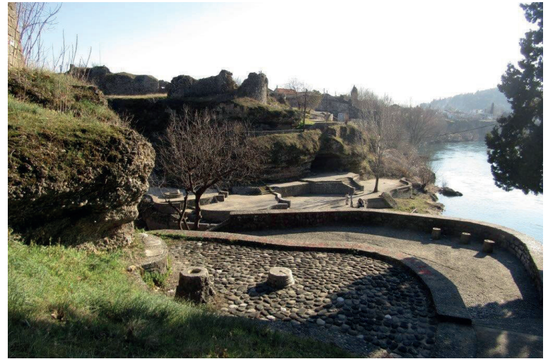
Příjemné zákoutí uprostřed města Podgorica

Na závěr bych se s vámi rád podělil o úspěch, kterého jste jako zaměstnanci součástí. Na základě práce naší odborové organizace a především díky stále rostoucí členské základně jsem byl pozván